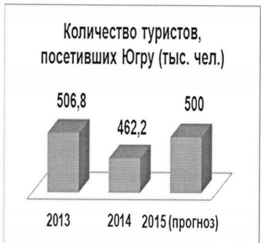
Число туристов, посетивших Югру (тыс.чел.)