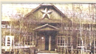
Здание Сургутского военкомата

Через час у памятника борцам, павшим за Советскую власть, состоялся митинг. Собрались все - от мала до