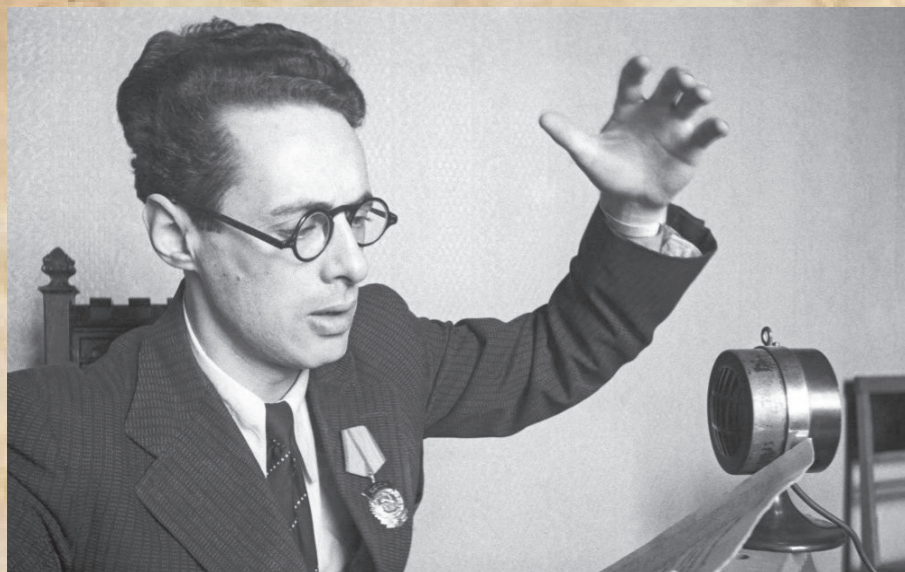
Юрий Борисович Левитан в годы Великой Отечественной войны читал сводки Совинформбюро и приказы Верховного Главнокомандующего И. Сталина.